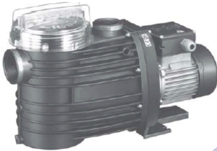
BETTAR / BADU Top

Speck Bettar 8 300000 230 V, 8m 3 /h Leistungsaufnahme: 0,58 kW